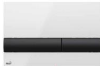
M1710-8 Fehér / Fekete